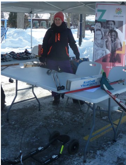
AQLPH et ZLM

ZLM remercie les organisateurs pour l'événement!